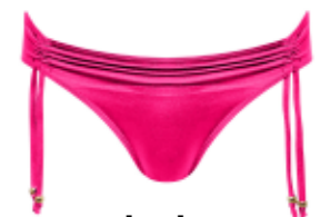
plavky NEW YORK

Duhová taška Influencer prostě září! Naskládejte do ni vše, co potřebujete na plážový piknik, a dopřejte si bezstarostné odpoledne s lahví prosecca. Bezstarostná letní jízda právě začíná.