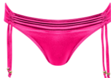
plavky NEW YORK