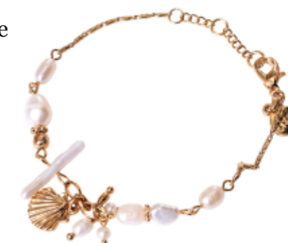
GOLD MARINE BRACELET