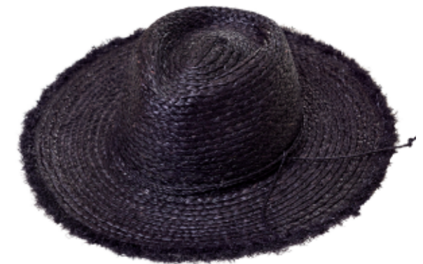
HAT JASMINA BLACK

Klobouk Jasmina v černé barvě báječně souzní se zlatými či skleněnými šperky. Zvolíte zlatý lesk náušnic Gold Chain nebo skleněný třpyt nášunic Gold Glass ?