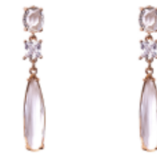
GOLD GLASS EARRINGS