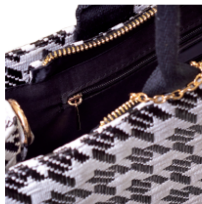
BAG BLACK AND WHITE