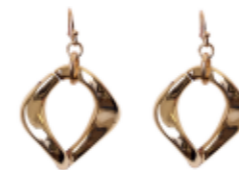
GOLD CHAIN EARRINGS

Duhová taška Influencer prostě září! Naskládejte do ni vše, co potřebujete na plážový piknik, a dopřejte si bezstarostné odpoledne s lahví prosecca. Bezstarostná letní jízda právě začíná.