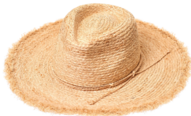
HAT JASMINA BEIGE

A umíte si představit dokonalé léto bez slamáku? My ne! Klobouk Jasmina Beige vás ochrání před oslepujícími slunečními paprsky, ale především ve vás probudí svobodného bohémského ducha.