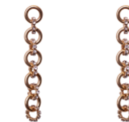
GOLD WATERFALL EARRINGS