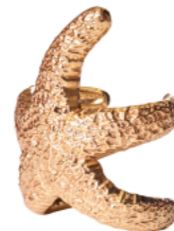
GOLD STAR BRACELET

Náramek Gold Star je doslova módní hvězdou naší šperkové kolekce. Jakmile jednou obemkne vaši ruku, už ho nebudete chtít odložit.