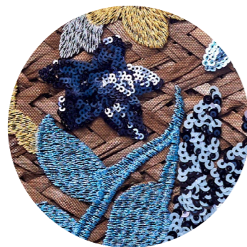
BAG BLUE REBEL