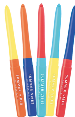
Mini tužka na oči a rty SUMMER VIBES