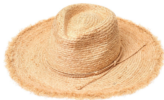
HAT JASMINA BEIGE

Plážová taška Blue Rebel vás zvenku okouzlí vyšívanou aplikací, zevnitř překvapí svou praktičností díky temně modré bavlněné podšívce. Hledáte-li perfektní doplněk na piknik na pláži nebo v městském parku, jste na správné adrese. Chybí už jen bageta, prosciutto a láhev vychlazeného vína.