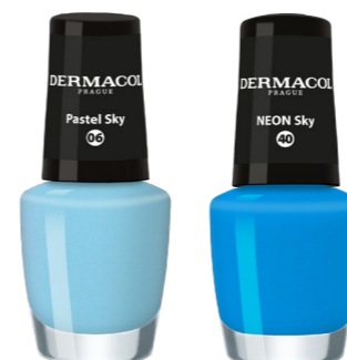
Lak na nehty odstín PASTEL SKY a NEON SKY

Baví vás hrát si s barvami? Dejte v létě prostor své kreativité s mini automatickou tužkou na oči a rty Summer Vibes . Můžete kombinovat pět šťavnatých odstínů.