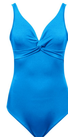
ONE PIECES PRAGUE