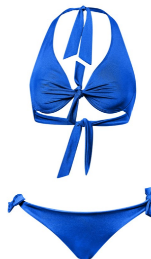
plavky BLUE REBEL