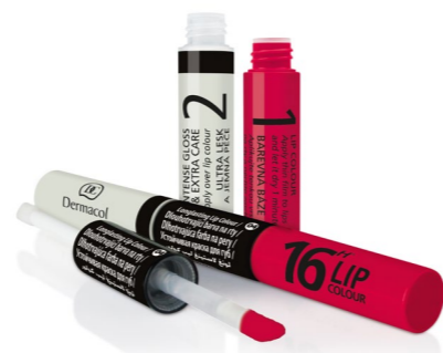
16H Dlouhotrvající dvoufázová barva na rty a lesk 2v1