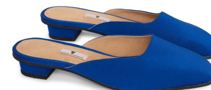
Mules BLUE REBEL

Elegantní monochromní vzhled v plavkách a doplňcích odstínů Zaffiro a Blue Rebel dovedete k dokonalosti s modrým lakem na nehty. Barva laků z kolekce Mini Pastel je úžasně lesklá, její trvanlivost ještě prodloužíte nanesením podlaku Fast Dry a nadlaku Ultra Gloss.